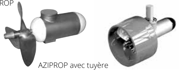
AZIPROP avec tuyère